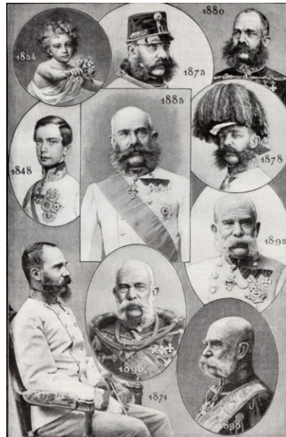
M3 Kaiser Franz Joseph I. (Foto Ludwig Angerer, 1859)