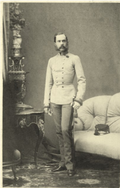
M2 Kaiser Franz Joseph I.

Der Fotoapparat und die Filmkamera waren damals nicht jedermanns Sache. Kaiser Franz Joseph I. war sehr skeptisch und ließ sich nicht gerne aufnehmen. Trotzdem findet man heute im Internet unendlich viele Aufnahmen und sogar Videosequenzen des Kaisers.