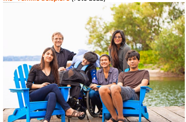
M6 Familie Beispiel 6 (Foto 2018)