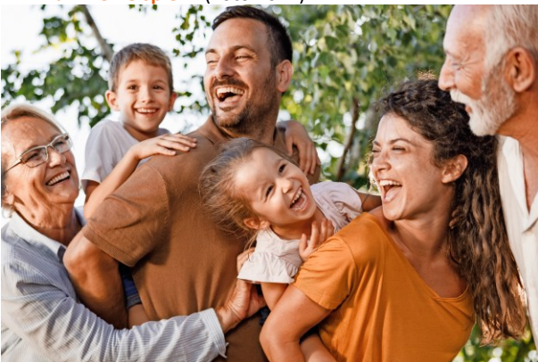
M2 Familie Beispiel 2 (Foto 2021)