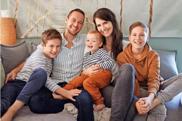
M1 Familie Beispiel 1 (Foto 2022)