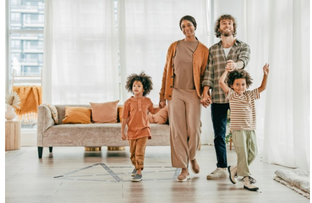
M4 Familie Beispiel 4 (Foto 2012)