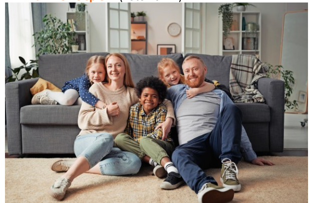
M5 Familie Beispiel 5 (Foto 2022)