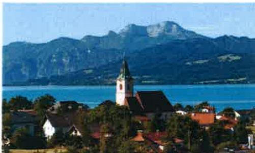
Weyregg am Attersee

3 Betrachtet das Salzkammergut auf dem Kartenausschnitt. Was fällt euch auf?