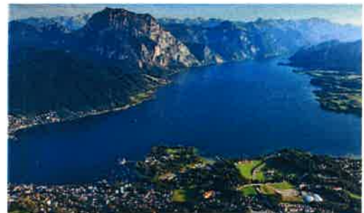
Gmunden am Traunsee

4 Das Salzkammergut erstreckt sich über drei Bundesländer. Notiere sie.