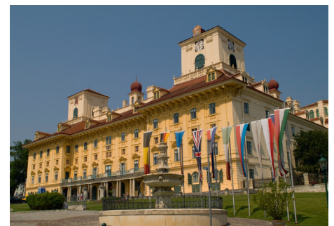
Ein Wahrzeichen von Eisenstadt – das Schloss Esterházy