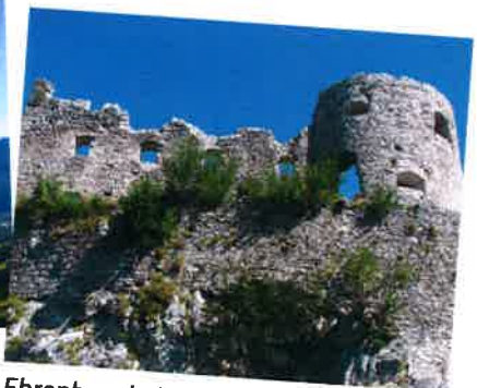
Ehrenberg bei Reutte