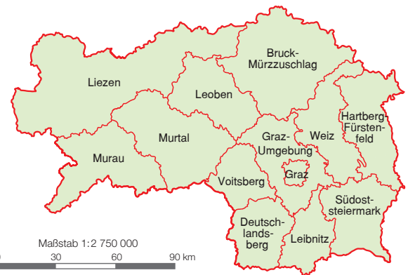
Politische Bezirke der Steiermark

Die Steiermark ist mit 16 401 km 2 flächenmäßig das zweitgrößte Bundesland Österreichs. Es grenzt an Oberösterreich, Niederösterreich, Kärnten, Salzburg, das Burgenland sowie an Slowenien. Die Steiermark besteht aus 13 politischen Bezirken. Es leben etwa 1 272 000 Menschen in diesem Bundesland. Die Landeshauptstadt ist Graz.