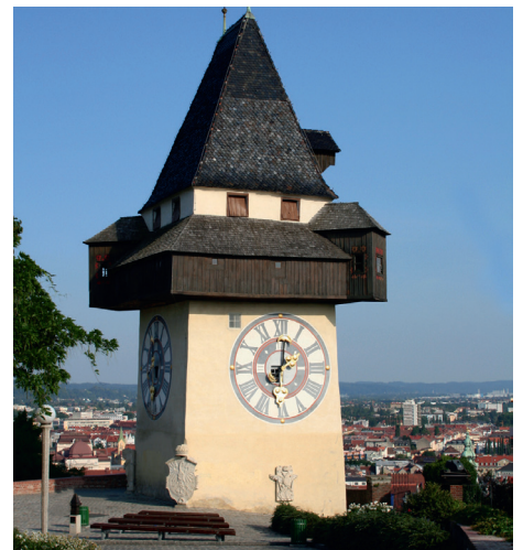
Ein Wahrzeichen von Graz – der Uhrturm