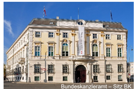
Bundeskanzleramt – Sitz BK