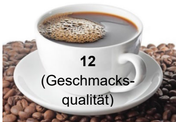
12 (Geschmacks- qualität)

8 Wenn man Gerüche nach einiger Zeit nicht mehr wahrnehmen kann, ist man _____.