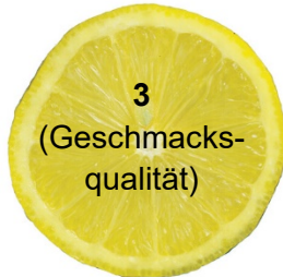
3 (Geschmacks- qualität)

Trage die abgebildeten Teile des Auges und die Lösungswörter aus den Hinweiskästchen in das Rätsel ein (ß = ss). In den farbige unterlegten Feldern findest du das Lösungswort.