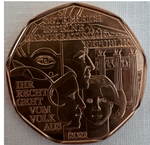
M4 Österreichische Münze Demokratie (2022)