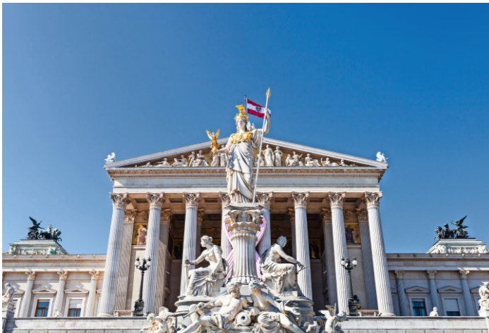
M3 Österreichisches Parlament in Wien (Foto 2014)