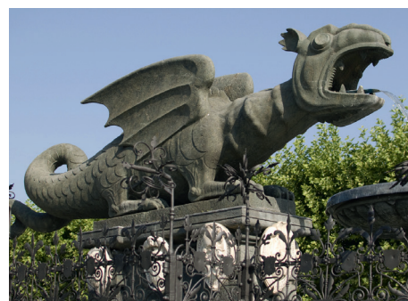
Das Wahrzeichen von Klagenfurt – der Lindwurm