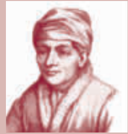
Johannes Müller Regiomontanus (1436–1476)

Aus „Erläuterung zum ptolemäischen Weltbild“ von Georg von Peurbach und Regiomontanus