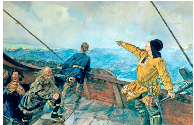
M4 Leif Eriksson entdeckt Amerika. (Gemälde aus dem Jahr 1893 von Christian Krohg (1852–1925))