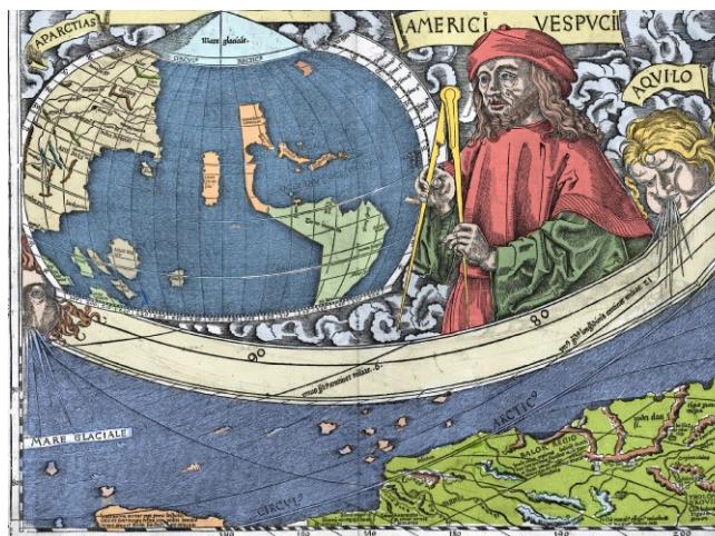
M2 Amerigo Vespucci (Illustration von Martin Waldseemüller, 1507)