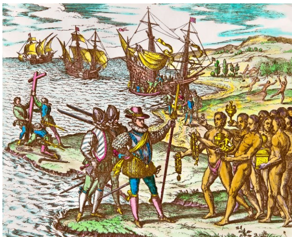
M1 Die Landung des Kolumbus 1492 (Kupferstich von Theodor de Bry aus dem Jahr 1594)

Christoph Kolumbus entdeckte Amerika. Zumindest hört man das immer wieder, also muss es doch stimmen. Oder? Im Buch gibt es aber auch einen Verweis auf einen anderen Entdecker, der Kolumbus um 500 Jahre zuvorkam. Auch das Internet weiß mehr darüber.