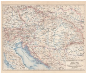
Doppelmonarchie (Karte 1877)

4 Ein Staat, der nicht zum Militärbündnis der Entente gehörte, war