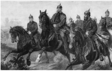
Kaiser Wilhelm I. zu Pferd (Gravur um 1870)

1 1871 wurde zum deutschen Kaiser (Wilhelm I.) ausgerufen: