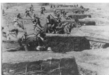
Schlacht am Isonzo (Foto 1916)

5 Die österreichisch-ungarische und die italienische Armee bekämpften einander in elf Schlachten am Fluss