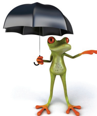
Bildquelle: julos – Thinkstock

1. In der Vergangenheit sagte man das Wetter oft mithilfe eines Wetterfrosches voraus. „Quaxi“, so wurde er im Kinderfernsehen genannt, saß in einem riesigen Gurkenglas, das liebevoll mit Grünpflanzen dekoriert wurde. Unter anderem befand sich auch eine Leiter im Glas. Je höher Quaxi auf die Leiter hüpfte, umso schöner sollte das Wetter werden. Verkroch er sich aber am Boden des Glases, stand Regen bevor.