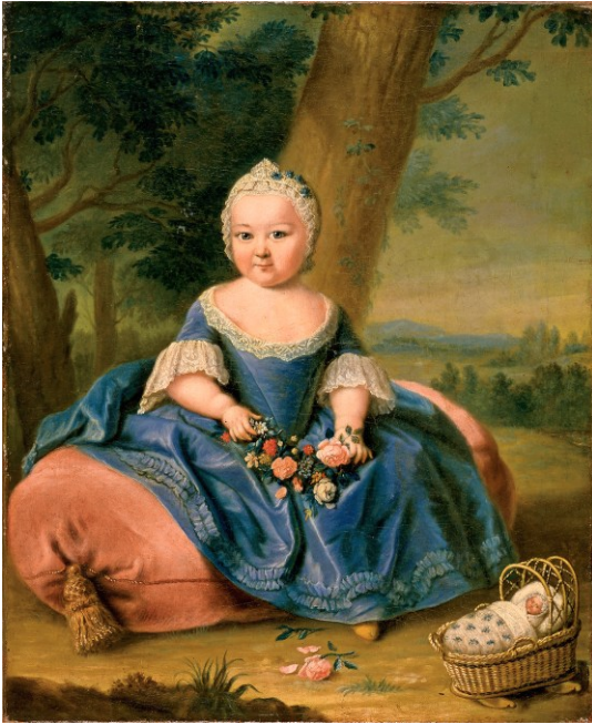
M1 Maria Theresia mit ca. drei Jahren (Gemälde, anonym, um 1718)