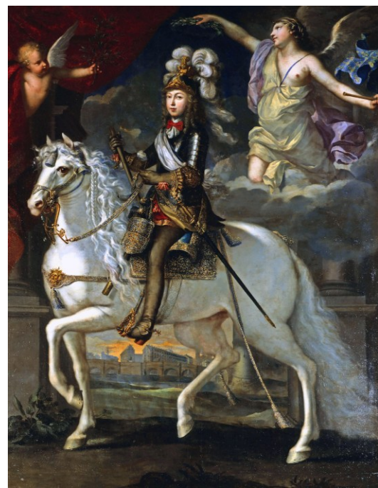
M4 Ludwig XIV. mit ca. 15 Jahren (Gemälde, Jean Nocret (1615–1672), um 1653)