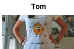
pour donner une information

4 Pourquoi des nouveaux vêtements? Qu'est-ce qui va avec qui? Reliez 2 noms, phrases et photos.