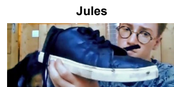
pour le style