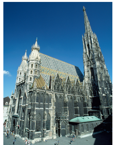
Das Wahrzeichen Wiens – der Stephansdom