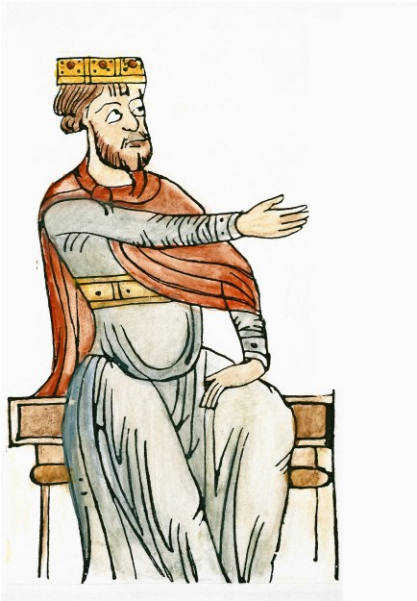
M1 Karl der Große (Buchmalerei, Rolandslied, Heidelberg, 12. Jh.)

Die Bilder, die du auf dieser Seite siehst, stellen alle einen mächtigen Herrscher des Mittelalters dar: Karl den Großen.