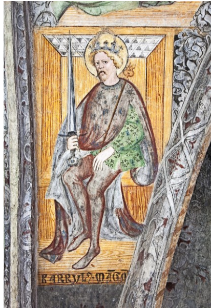
M3 Karl der Große (Fresko, Dom von Brixen, 15. Jh.)