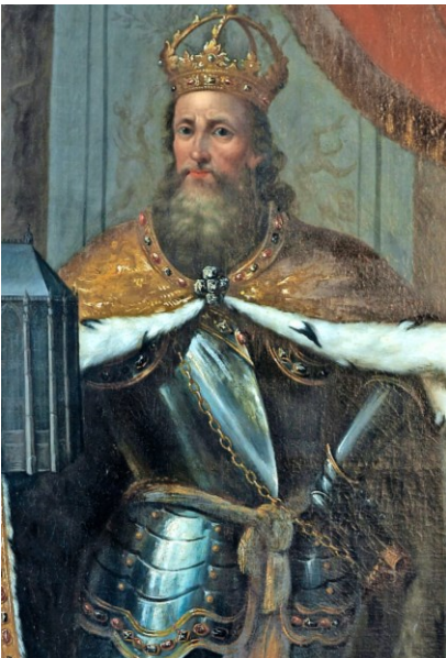
M2 Karl der Große (Gemälde J. Ch. Bollenrath, 1730, Rathaus Aachen)