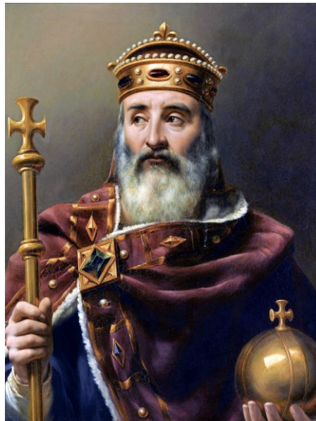
M4 Karl der Große (Louis-Félix Amiel, Öl auf Leinwand, 1837)