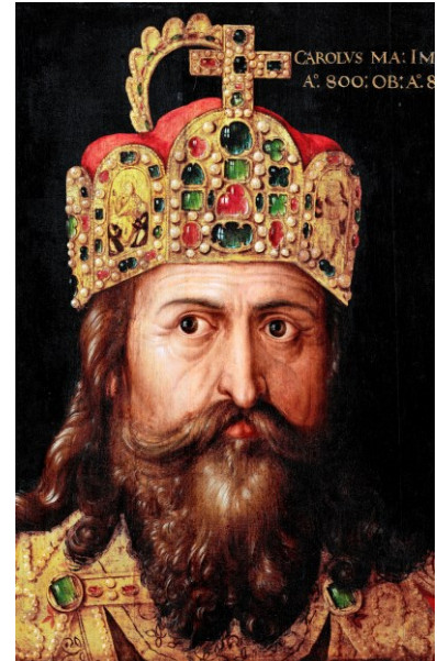
M5 Karl der Große (Albrecht Dürer, Öl auf Holz, 1514)