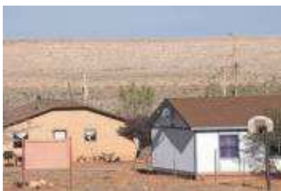
Häuser in einem Reservat in Arizona/USA