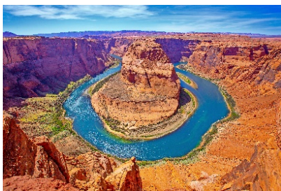
Colorado River in Arizona/USA