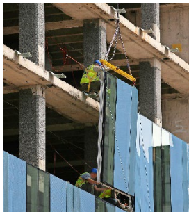
Baustelle in den USA