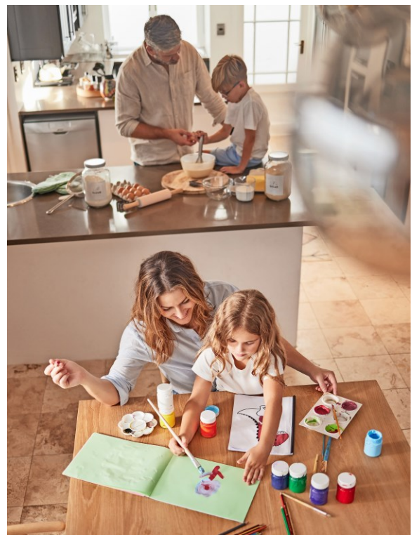
M2 Alltag heute (Foto 2014)