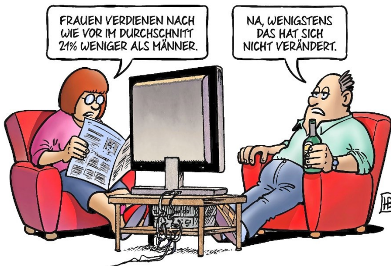
M2 Gender Pay Gap (Harm Bengen, 2018)