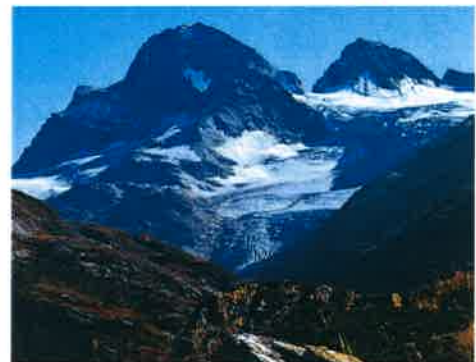
Piz Buin im Silvrettagebirge

flach • felsig • hügelig • gebirgig • fruchtbar • zerklüftet • bewaldet • schroff • Ebene • Almen • Felder • Wiesen • Wald • Berge • Gebirge • Hochgebirge