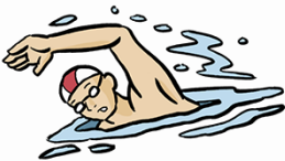
nager / la natation