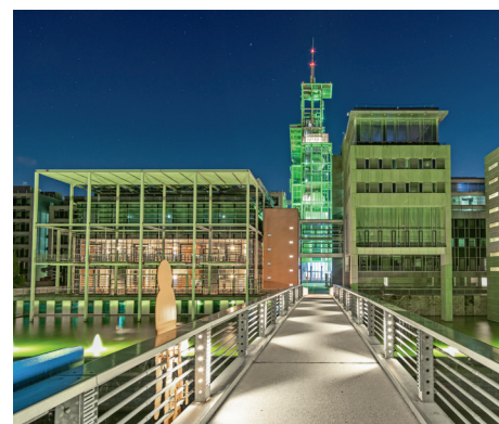
Ein Wahrzeichen von St. Pölten – der Klangturm