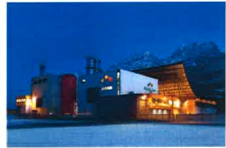
Biomasse Heizwerk Lienz

Ein großer Teil Tirols ist mit Wald bedeckt. Holz ist ein nachwachsender Rohstoff und kann sehr gut zur Energiegewinnung genutzt werden. In den letzten Jahren wurden einige neue Heizkraftwerke für die Wärme- und Stromgewinnung errichtet.