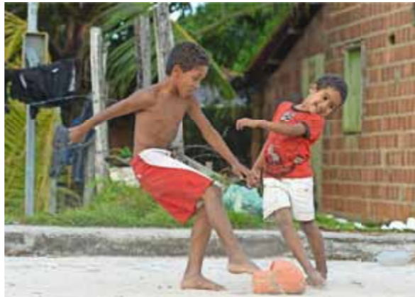
Kinder in Brasilien beim Fußballspielen (2014)

Am Rande der Welt. So ist es mir jedenfalls vorgekommen. Von irgendwoher kam eine staubige rote Straße und führte durch unsere Stadt. Dann weiter zum Waldrand, wo die Männer Bäume fällten. Jenseits des Waldrandes gab es nichts mehr, so hat 's mir mein Vater gesagt. Damit meinte er, dass der Wald von da aus endlos weiterging. Jeden Tag kamen im Morgengrauen Pick-ups zum Stadtrand, wo Männer warteten. Darunter auch mein Vater; er stieg auf einen und fuhr zur Arbeit, Bäume fällen. [...]